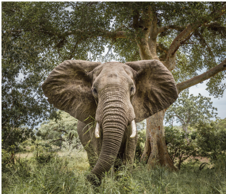
Die Charaktereigenschaften des Elefanten spiegeln die Werte des Unternehmens und des Fondsmanagements wider.

Daher ist es ETHENEA eine Herzensangelegenheit, einen aktiven Beitrag zum Schutz der Elefanten zu leisten. In diesem Jahr ist das Unternehmen offizieller Sponsor der „Elephant Parade Swiss Tour 2020“. Die Wanderausstellung macht auf das Schicksal der stark bedrohten asiatischen Elefanten aufmerksam und sammelt seit 2007 mit seinen Paraden