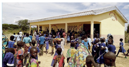
Primarschulhaus in Kamerun.

weltweit Gelder für Hilfsprojekte in Asien.